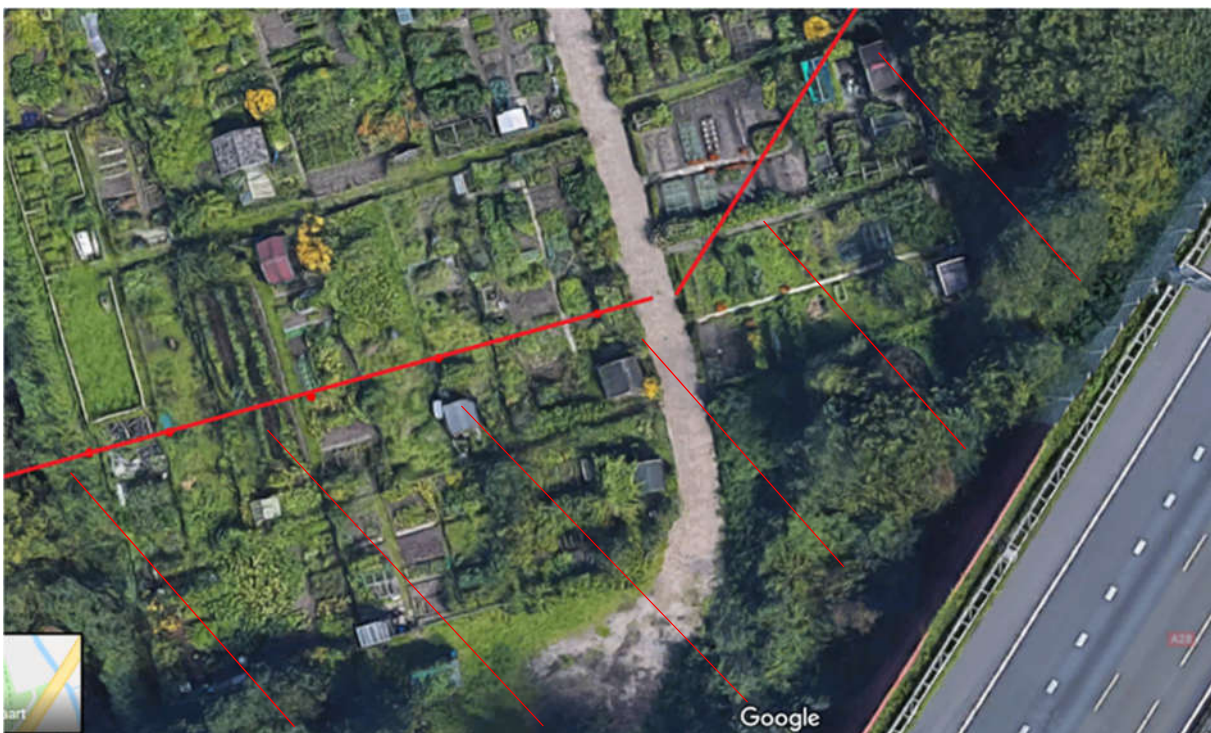
Afbeelding 3: Gronden die aan het complex zullen worden onttrokken

Uit deze tekening maken wij op dat het echter niet blijft bij dit ruimteverlies. Het plan is klaarblijkelijk een deel van de moestuin ook nog in te richten als landschappelijke inpassing, waterhuishouding en beplantingsvlak! Dit is in de vooroverleggen nooit ter sprake gebracht. In plaats van de verwachte opschuiving van 3 à 4 meter, zal nu een strook van minimaal 25 meter aan het moestuincomplex onttrokken worden. Dit betekent een aanzienlijk deel van het complex waardoor een groot aantal moestuinen opgeheven zal moeten worden (zie afbeelding 3).