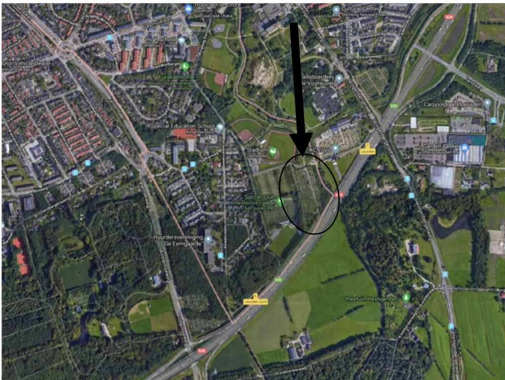
Afbeelding 1: Locatie Volkstuinvereniging Dorrestein

Het volkstuintencomplex Dorrestein ligt in het Beekdal van de gemeente Amersfoort op de locatie Dorrestein, pal naast de A28 tussen de knooppunten Leusden en Leusden-Zuid (zie afbeelding 1).