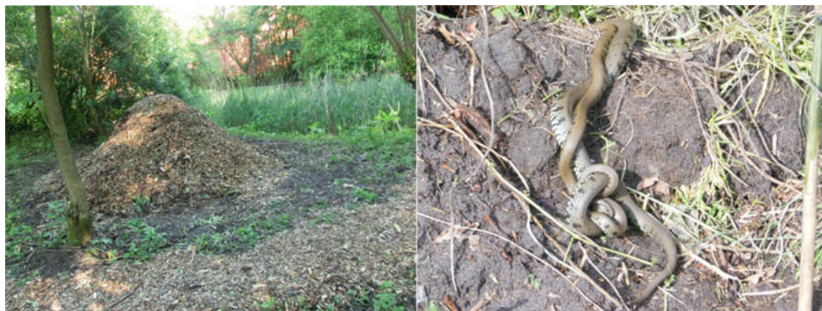
Afbeelding 4: Ringslangenhoop en ringslangen Volkstuinencomplex Dorrestein

Naast dat de plannen ten koste gaan van de moestuinen, zullen deze ook leiden tot de vernietiging van een stukje natuur. In tegenstelling tot wat er in de bijlage Natuur van het MER staat is er bijvoorbeeld wel degelijk een voortplantingsplaats en winterverblijf van ringslangen bij de Heiligenbergerbeek. Beide zijn op ons volkstuincomplex aanwezig. Met regelmaat worden grote en kleinere ringslangen gezien. Ook parende ringslangen zijn gesignaleerd (zie afbeelding 4) en de broeihoop is succesvol; resten van uitgekomen ringslangeieren worden daar gevonden.